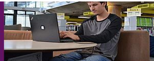
امانت گرفتن لپ تاپ