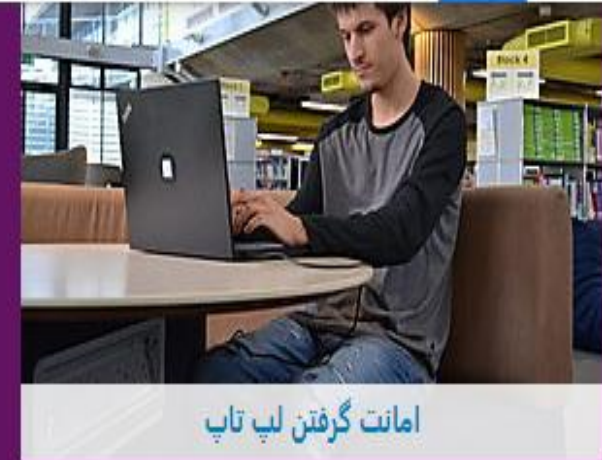
امانت گرفتن لب تاپ