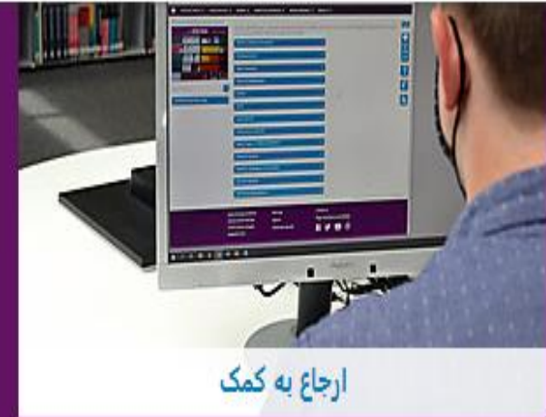
ارجاع به کمک

خوش آمدید چه چیزی در آن برای شما؟ Opening hours