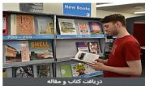
دریافت کتاب و مقاله

اخبار و مشکلات شناخته شده تقویم رویدادهای کتابخانه آخرین تغییرات محتوا صندوق پیشنهادات