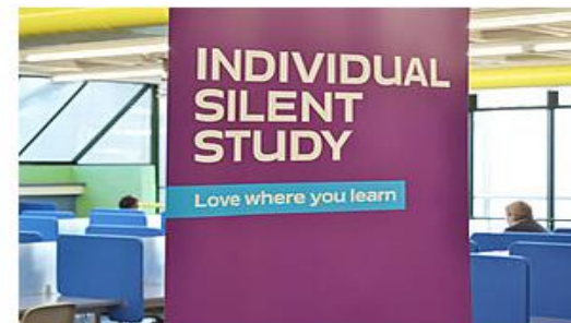
یافتن فضایی آرام برای مطالعه