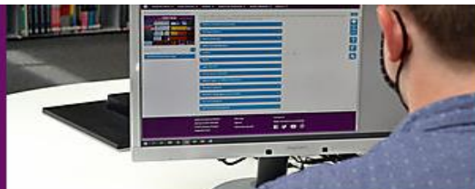
ارجاع به کمک