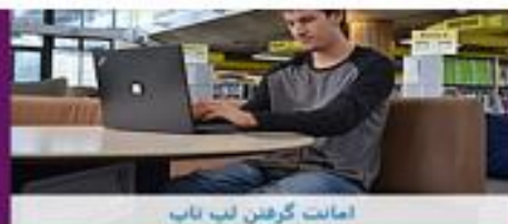
امانت گرفتن لب تاب