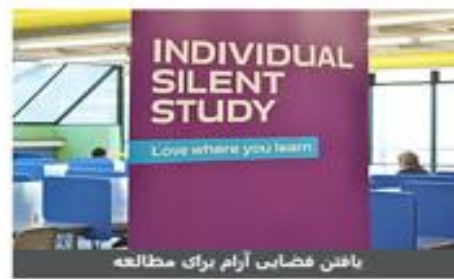
یافتن فضایی آرام برای مطالعه