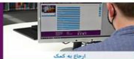
ارجاع به کمک