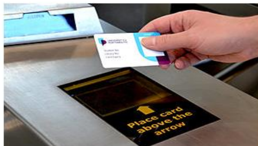
خدمات چاپ کارت دانشگاه