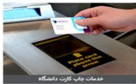
خدمات چاپ کارت دانشگاه