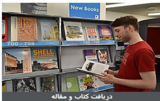
دریافت کتاب و مقاله

اخبار و مشکلات شناخته شده تقویم رویدادهای کتابخانه آخرین تغییرات محتوا صندوق پیشنهادات